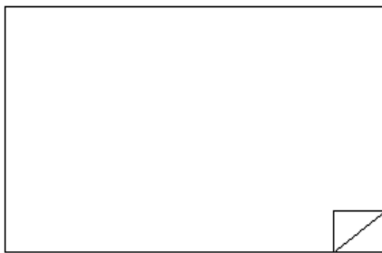
앞면: 그림 그리는 면 (※ 인적사항 기재란이 있는 면)